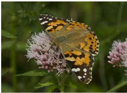
Distelvlinder [ Vanessa cardui ]

De brede bermen van deze kade waren kort geleden gemaaid, maar langs het pad stonden toch Wilde cichorei en Knoopkruid te bloeien en langs het water Koninginnekruid; er vloog een grote oranje-achtige vlinder rond die, toen hij even stil zat, een Distelvlinder bleek te zijn.