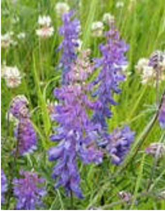
Vogelwikke [ Vicia cracca ]