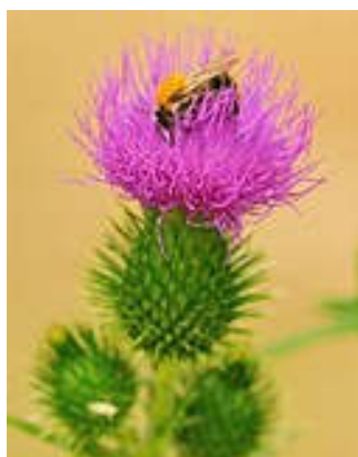
Akkerdistel Cirsium arvense

De Haagwinde stond hier massaal en bloeide rijk, evenals de Vogelwikke.