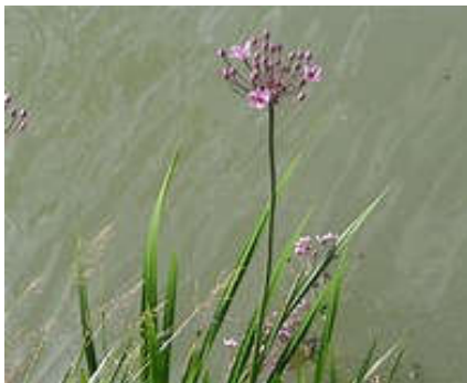
Zwanebloem] [ Butomus umbellatus ]

Nagenietend van deze mooie waarnemingen sloegen we linksaf, het brede pad richting Noorderelsweg op om even verder rechtsaf te slaan, de bruine markering following. Dit brede wandelpad werd een hoger gelegen kade met brede sloten erlangs. In het water stonden de Zwanebloem en het Pijlkruid te bloeien, terwijl in de brede berm Grote klit, Teunisbloem en Bijvoet gezien werden.