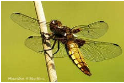
Platbuik [ Libellula depressa ]

Ook Kantig hertshooi en Hazepootje groeiden er; Platbuiken (een libel) begeleidden ons, en even verderop de Rode heidelibel.