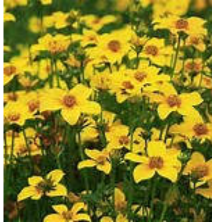
Tandzaad [ Bidens ]

De bloemen hadden gele lintbloemen en enkelvoudig, langwerpige blad; de flora bracht uitkomst, hier stond Knikkend tandzaad. Maar er stond ook een andere Tandzaad-plant tussen met gedeelde blaadjes en zonder lintbloemen; dit bleek Zwart tandzaad te zijn. Het smalle paadje kwam weer uit op het hoofdpad voorzien van hoge Essen. In de sloot langs het pad ontdekten we druk bewegende insecten op het water: een smalle soort met lange poten bleek de Vijverloper te zijn, en de kleine, gedrongen, zilverachtige, druk bewegende insecten waren Schrijvertjes wat duidde op een goede waterkwaliteit. We kwamen bij de hoogspanningsmasten die ons pad kruisten en daar was bovenin druk gefladder en gekrijs van vogels. De verreijker erbij en toen bleek dat we enkele Torenavalken zagen, ouders met jonge vogels. Maar dat was niet alles, want hoger in en bij de mast vlogen enkel Slechtvalken én we ontdekten een Sperwer.