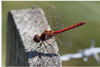
Rode Heidelibel [ Sympetrum fonscolombii ]

De brede bermen van deze kade waren kort geleden gemaaid, maar langs het pad stonden toch Wilde cichorei en Knoopkruid te bloeien en langs het water Koninginnekruid; er vloog een grote oranje-achtige vlinder rond die, toen hij even stil zat, een Distelvlinder bleek te zijn.