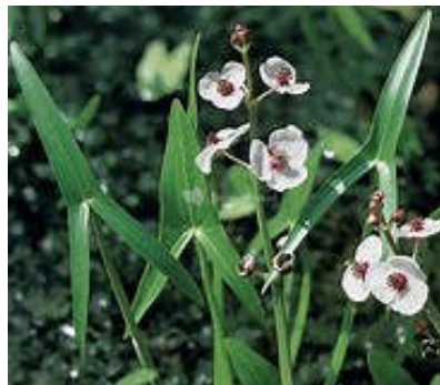
Pijlkruid [ Sagittaria sagittifolia ]