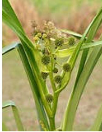
Grote Egelskop [ Sparganium erectum ]

Maar ook de Akkerwinde groeide en bloeide hier. We passeerden twee soorten Kaasjeskruid, Muskus kaasjeskruid en Groot kaasjeskruid. Bij de laatste sloot van onze wandeling zagen we Grote egelskop en Kikkerbeet in het water staan. Onder begeleiding van diverse Icarus blauwtjes voltooiden we de wandeling. Zeker in deze tijd van het jaar is deze wandeling een aanrader. Hij is 4,5 km lang en in anderhalf uur af te leggen.