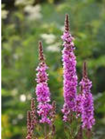
Grote Kattestaart [ Lythrum salicaria ]

Op het blad van Jacobskruiskruid zat een nachtvlinder; het bleek een Gamma-uil te zijn, herkenbaar aan het witte gammateken op beide vleugels. Hooibeestjes vlogen hier massaal rond. Na de Witte honingklaver zagen we langs de oever van de plas prachtig paars bloeiend de Grote Kattestaart staan én geel bloeiende composieten die herkend werden als Tandzaad.