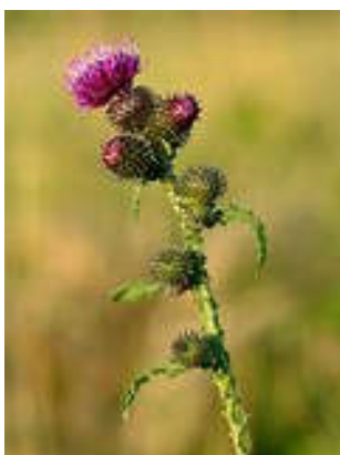
Kruldistel Carduus crispus

We kwamen bij een manege, waar een wegsplitsing was. Onze bruine route wees naar rechts en zodoende gingen we via een brug eerst de brede sloot over richting Zeedijk om dan uit te komen op de nieuwe kade met fietspad onderlangs, die we nu volgden tot de Zeedijk. Net voor deze dijk sloegen we rechtsaf om via een lang gras pad terug te lopen richting Oosthaven. Veel waarnemingen deden we hier niet meer, maar toch is de Kruldistel of is het de Stekelige distel het vermelden waard, omdat hij er veel stekeliger uitziet, en is, dan de alom aanwezige Akkerdistel.