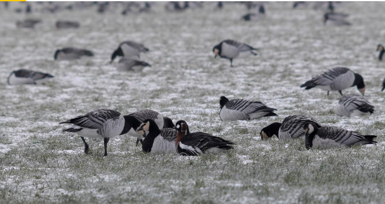
Roodhalsgans tussen de Brandganzen